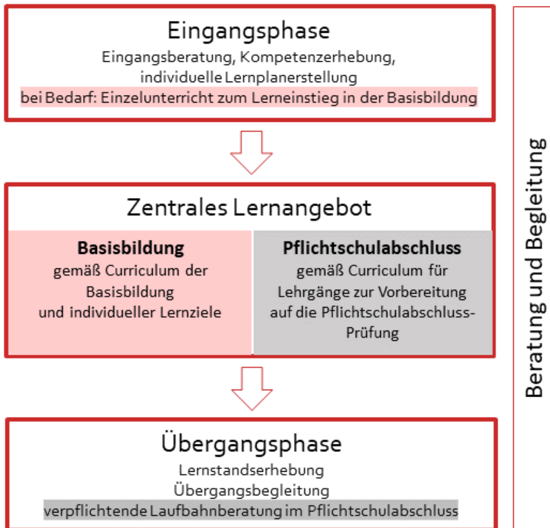
Abbildung 3: Die Grafik zeigt eine Übersicht der Phasen des Bildungsangebots. Das zentrale Lernangebot wird von einer Eingangsphase und einer Übergangsphase umrahmt und durch kontinuierliche Beratungsangebote begleitet.

Wenn Unterrichtseinheiten nicht in Präsenz, sondern online erfolgen und als dauerhafter Bestandteil in das Bildungsangebot aufgenommen werden, darf der Anteil des Fernunterrichts maximal 30% des Bildungsangebots betragen. Die Online-Lerninhalte, die Konzeption und Sicherstellung der technischen Voraussetzungen, eine Begründung der Eignung des Online-Formats und die Kommunikations- und Begleitprozesse während der Online-Lernphasen sind darzustellen.